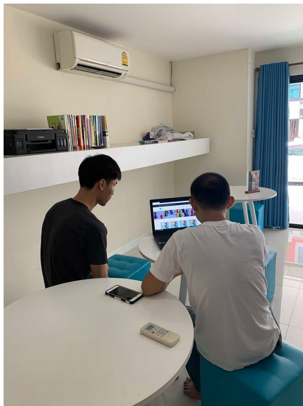
ภาพที่ ค.9 ภาพให้เจ้าของสถาบันทดลองใช้งานโปรแกรม