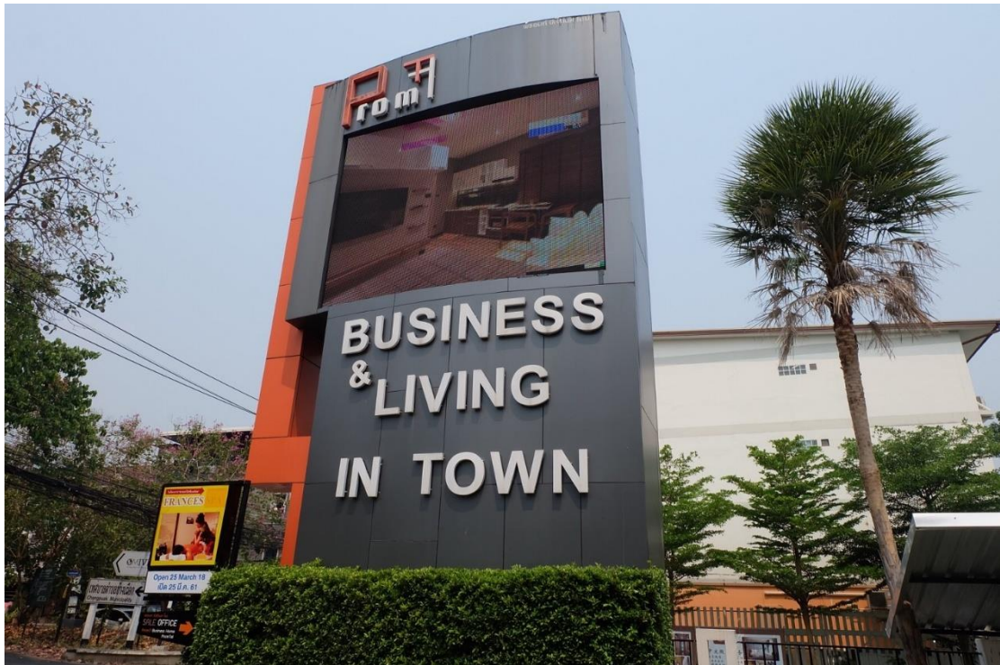
ภาพที่ ค.6 ภาพโครงการที่ตั้งสถานที่ประกอบการสถาบันกวตริษา CMU Tutor