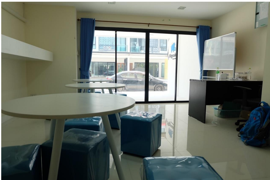
ภาพที่ ค.7 ภาพบริเวณภายในสถาบันกวตริษา CMU Tutor