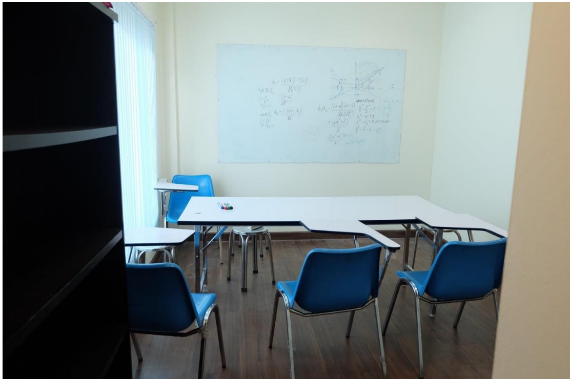
ภาพที่ ค.8 ภาพบริเวณภายในห้องเรียนสถาบันกวตวิชา CMU tutor